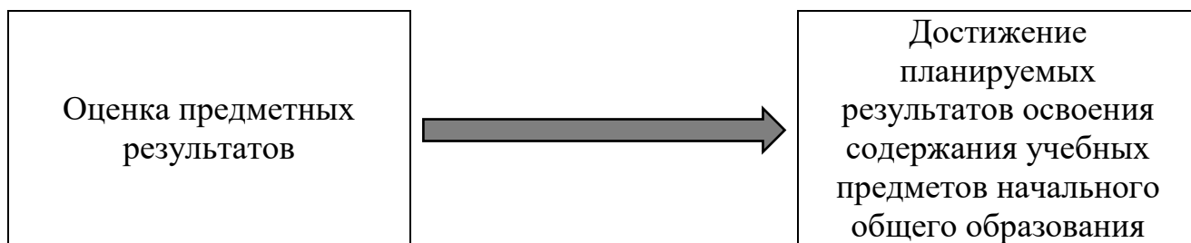
Рис. 1. Влияние системы оценки на образовательную деятельность

Система оценки как комплекс оценочных процедур мотивирует учащихся на достижение планируемых результатов различных групп, но важным условием повышения уровня мотивации к образованию в течение всей жизни, освоению умения учиться является реализация программы формирования универсальных учебных действий, включающей типовую задачу «Технология безотметочного оценивания». Применение данной технологии позволяет сократить количество оценочных процедур, проводимых учителем на уроках, переориентировать систему оценки с «накопления отметок» на фиксацию достигнутых учащимися планируемых результатов, а также обеспечить формирование у учащихся универсальных учебных действий – контроля, оценки, познавательной рефлексии и смыслообразования.